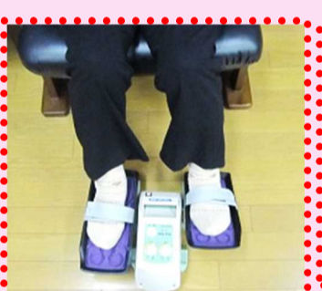
自動足首運動器(人気)

種類が豊富な脳トレーニング。パズル・間違いさがし・写経他。記憶力・思考力の維持・改善!