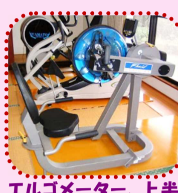
エルゴメーター、上半身・心肺の機能改善