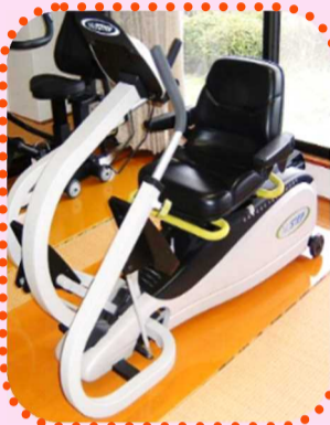
ステップマシーン