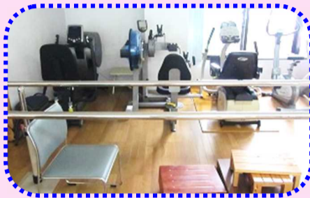
リハビリスペース