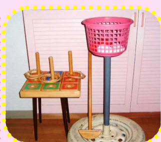
気分転換と機能回復をかねた、レク運動(ミニ・ゲーム)