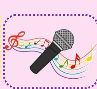
カラオケ・ダム設置