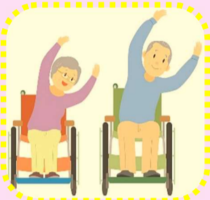
ソフトヨガを取り入れた、オリジナルのイス体操